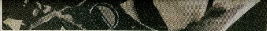
Федерико Феллини во время съемок.

Набор этих знаковых пунктов, с одной стороны, очевиден каждому, кто знаком с творчеством Феллини, с другой – красиво прописан с точки зрения феллиниевской биографии и психологии подсознательного. В этом смысле уникальным документом на выставке является так называемая «Книга снов» – сборник рисунков, на которых Феллини по совету юнгианского психоаналитика Эрнста Бернгарда запечатлевал свои сны, страхи и фантазии на протяжении 30 лет (между 1960 и 1990 годами). Чего тут только нет, но больше всего – женщин. По-итальянски фигуристых и грудастых, розовых, соблазнительных, обнаженных созданий, плавающих в облаках, сидящих в вызывающих позах и даже становящихся для героя фантазий транспортным средством. Женщины в их многообразии от архетипических образов до простейших объектов вождения – это, безусловно, одна из тех статей, без которых «энциклопедию Феллини» представить невозможно. Они прелят балом на протяжении всего его творчест-