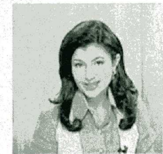
Сегодня на "Худсовете". 22 декабря 2010 года

НОВОСТИ КУЛЬТУРЫ на неделе 00:01 22.12 среда